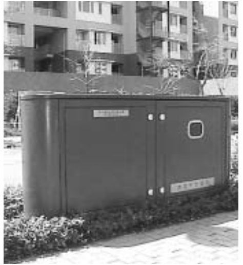
配水モニター装置(西宮浜)

また、市内の配水管の水质データー等を24時間監視するため、配水管網の末端に配水モニター装置を設置して、水质監視体制の強化を図ります。配水モニター装置は、16年度から18年度までの3カ年で12カ所整備する計画で、最終の18年度は市内の4カ所を予定しています。