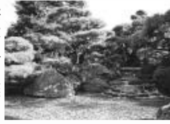
心がやすらぐ日本庭園の眺め

所蔵品を様々なテーマに沿って紹介するほか、日本の近代美術史に関する展覧会をはじめ、毎年恒例の「イタリア・ポロニア国際絵本原画展」、ジャンルにとわれないユニークな展覧会に、現代の動向をとらえる最新