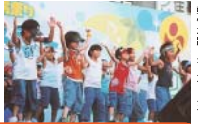
軽やかな踊りをステージで