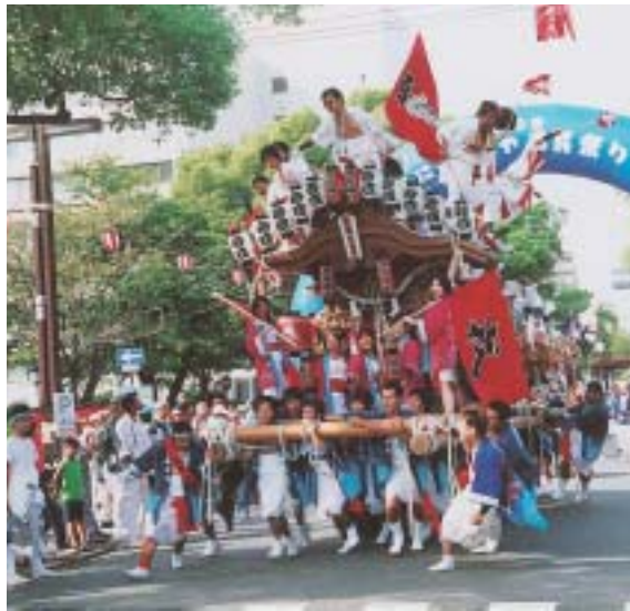
勇壮な地車の行進は活気があり、迫力満点です