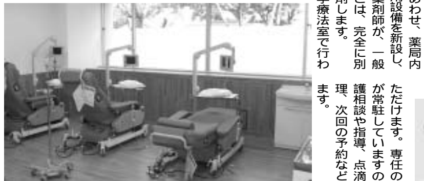
「より快適に、より安全に」をテーマに、9月にオープンした外来化学療法室

従来との違い 独立化し、患者様のプライバシーに配慮 専任スタッフの配置で、患者様対応を充実 チームで患者様の治療内容を把握 使用する抗がん剤は、薬剤部で独立して調剤 リクラニングチェア導入で、療養環境を改善 化学療法を受けられる方の専用の治療室です。他の外来患者様は入室されぬよう、プライバシーに配慮してあります。当室では、専任看護師、薬剤師、医師などの医療スタッフがチームを組み、個々の患者様の治療内容とスケジュールを把握し、治療後のケアを行います。