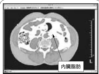
内臓脂肪型肥満は、様々な病気の要因となります。早期に発見し、生活改善を行うことで、病気を未然に防ぐことができます。

内臓脂肪検査 内臓脂肪の量を測定する検査です。内臓脂肪の蓄積は様々な病気を引き起こしやすくなります。このような状態をメタボリックシンドロームと言います。「高血圧症」、「糖尿病」、「高脂血症」を重複して発症する恐れがあり、動脈硬化のリスクが高くなります。歯科口腔疾患検査、歯科レントゲン検査、歯、歯周組織の疾患だけでなく口腔全体の腫瘍の有無などを調べます。マンモグラフィ検査、X線による乳房撮影により、触診と合わせる事で乳がんの発見率が向上します。四十歳以上の方にお勧めです。 腫瘍マーカー検査 検査方法は採血のみです。ある種のがんでは、一定の検査項目が高値になります。ただし、初期のがんでは数値として現れない場合があるなど、あくまでもがんの補助診断として役立てようとするものです。 骨密度検査 年齢を重ねると骨密度が低下し、骨がもろくなります。これが骨粗しょう症で、腰痛、脊椎の変形、ちよっとしたことで骨折の原因となります。この検査で骨の状態を知ることができます。