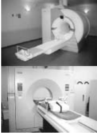
写真(上)=MRI(磁気共鳴断層装置)...脳動脈瘤などの脳疾患等の発見に脳ドックで活躍。写真(下)=CT(X線コンピューター断層撮影装置)...ヘリカルCTで肺疾患等の発見に肺ドックで活躍