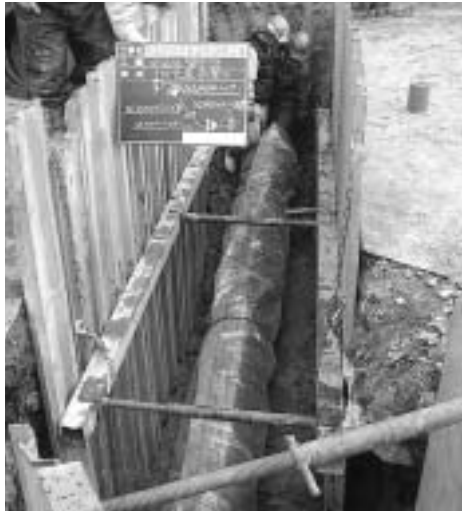
配水管の耐震化布設替工事(神楽町)

水道局では、安定供給に向け、より効率的・効果的な事業運営を目指すため、3カ年ごとに財政計画を策定し、経営の見直しを行っています。平成17年度は平成16年度からの財政計画の2年目です。