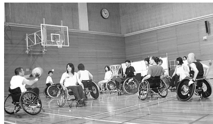
▲車いすバスケット(総合福祉センター)

障害者生活相談・支援センター「のまネット西宮」では、新たに精神障害分野での相談支援事業をこれまでの事業と一体的、総合的に展開していきます。また、西宮市における総合的相談支援センターとして、市内関係機関や事業所等とのネットワーク形成、仕組みづくりを市と協働して推進します。