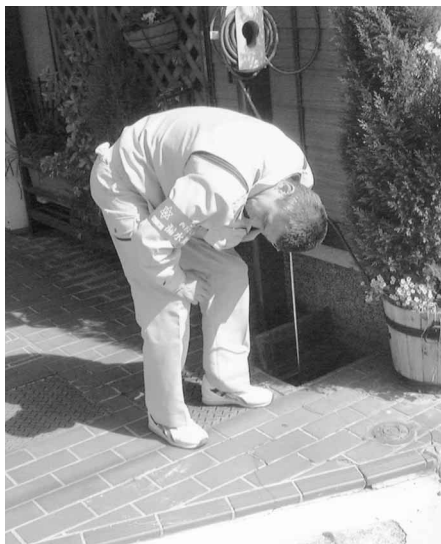
漏水の音聴調査作業

調査は、平成15年度から、水質基準の規制が強化される見込みであり、鉛管の使用状況調査も併せて行います。