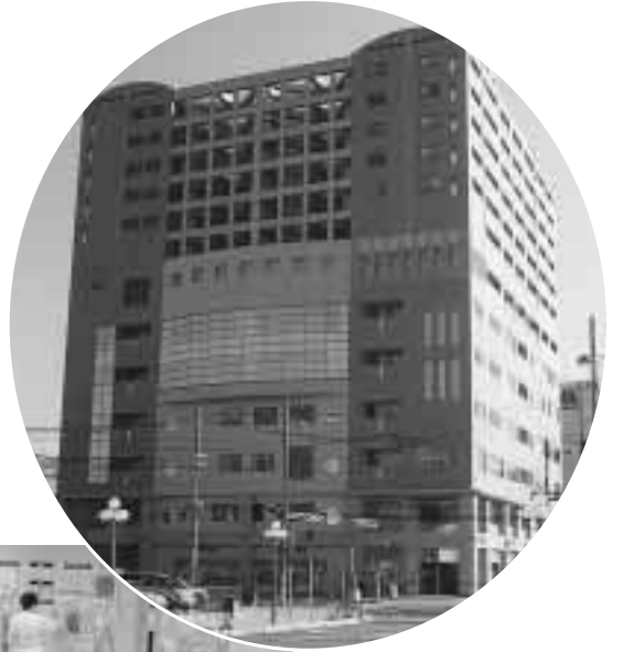
ウェーブは、阪急西宮北口駅南側のプレラにしのみや内に開設。交流を広げたり、知識を深めたりすることができます

男女がお互いに協力し合い、住みよい社会を築いていく - 職場や家庭での性別役割分担、社会問題となっている家庭内暴力などをみると、わが国では、まだまだ対策が十分とはいえません。国は、社会のあらゆる分野での活動に男女が対等に参画し、等しく利益を受け、責任を担う社会の実現を21世紀の最重要課題としています。市も、新女性プランを策定するとともに、推進拠点となる男女共同参画センター「ウェーブ」をオープンし、市民参画のもと様々な講座やイベントを展開しています。ウェーブを利用して、男女共同参画について考えてみてください。