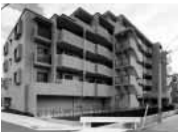
[エスポワールSYU外観図]

所在地 西宮市荒木町9番18号 専有面積 69.44m~ 入居者負担額 84,000円(月額)~