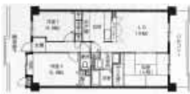
[エスポワールSYU平面図]

上記の物件は一例です。入居申込み資格として2人以上の世帯であること、収入の上限、下限制限があることなどいくつかの条件があります。