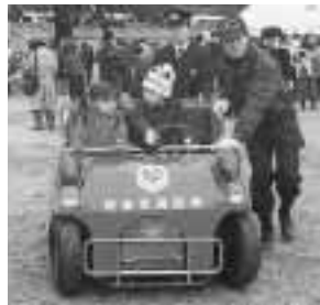
ミニ消防車にも乗れます

消防局と西宮市消防団は、来年1月6日に行われる「消防出初式」のバリエーションとして、ミニ消防自動車試乗コーナーや救急車などの見学コーナーも設けられます。