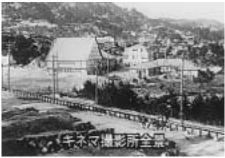
甲陽園にあった映画撮影所について紹介

市はこのほど、広報ビデオ「知られざる西宮」を制作しました。写真は一場面。大正時代、甲陽園には映画撮影所・東亜キネマがありました。当時撮影されたサイレント映画などを紹介しながら、あまり知られていない西宮の歴史に迫ります。