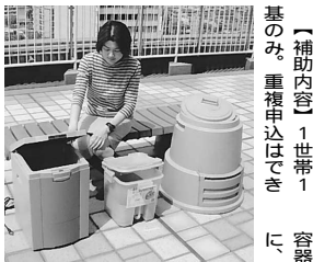
生ごみ処理機(左)や生ごみたい肥化容器(中・右)の購入に補助金を交付します。見本は(み企画課)にあります。