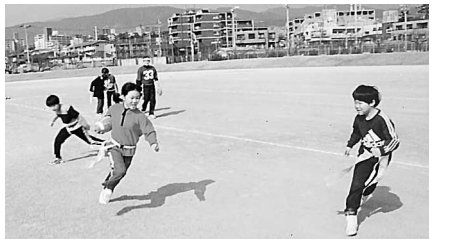
フラッグフットボールなんかまだまだやっていた～と思うほど楽しかった。

「プレラ塾」参加者の親から「与えられたことだけでなく自分で考え話し合い、行動していく事で家庭では出来ない社会的、協調性、忍耐力などが培われたと思います。」 「この1年で何よりも息子の新しい事に取り組む意欲の芽がぐんと伸びたように思えてとてもうれしく思