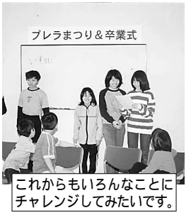
プレラまつり&卒業式