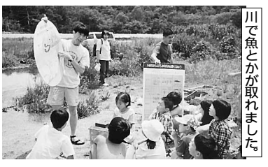
川で魚とかが取れました。