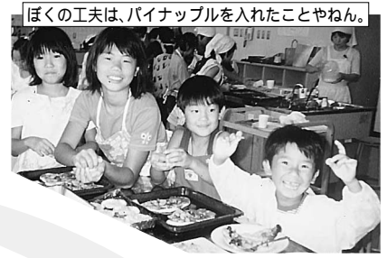
ぼくの工夫は、パイナップルを入れたことやねん。

います。」 「『次は何かな?』という受身の姿勢だったものが、後半には自分達のイベント案が採用されたこともあって『どうやってやるんだろ?』に変わっていき、積極的に進んでました。」 「プレラ塾を経験した子どもたちが、各地域で活躍してくれたらいいなと思います。」