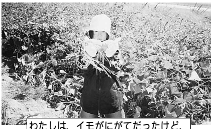
わたしは、イモがにがてだったけど、なんだかその時おいしいと思ったよ。

講師 こども環境活動支援協会/名塩和紙学習館 ネイチャープランニング 喜多敏弘 対象・定員 市内の小中学生 30名(1年を通して参加出来る方) 集合・解散 鳴尾公民館 受講料 無料(ただし、一部実費負担)(第1回 3,200円、第2回 600円、第3回 3,000円、第4回 1,500円) 申込方法 往復ハガキに①氏名、②学年(年齢) ③住所、④電話番号、⑤参加可能日を明記のうえ郵送でお申し込み下さい。 申込先 〒663 8204 西宮市高松町4 8 西宮市立中央公民館「なるお体験塾」係 申込締切 6月3日(月)必着 定員超過の場合は抽選 主催・問合せ 中央公民館 ☎(0798) 67 1567・64 9482