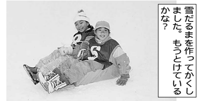
雪だるまを作ってかきました。もつとけていますか？

講師 こども環境活動支援協会/名塩和紙学習館 ネイチャープランニング 喜多敏弘 対象・定員 市内の小中学生 30名(1年を通して参加出来る方) 集合・解散 鳴尾公民館 受講料 無料(ただし、一部実費負担)(第1回 3,200円、第2回 600円、第3回 3,000円、第4回 1,500円) 申込方法 往復ハガキに①氏名、②学年(年齢) ③住所、④電話番号、⑤参加可能日を明記のうえ郵送でお申し込み下さい。 申込先 〒663 8204 西宮市高松町4 8 西宮市立中央公民館「なるお体験塾」係 申込締切 6月3日(月)必着 定員超過の場合は抽選 主催・問合せ 中央公民館 ☎(0798) 67 1567・64 9482