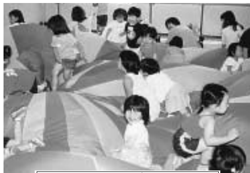
キャーキャー パラバルーン大好き!!

子育ての難しい時代だと思おう。三十万人にも達すると言われる若者の未就職者不登校者は十万人以上とい