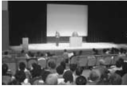
プレラホールでの講演風景

公民館では10月7日(月)午後1時半から、一般参加者を交えて、公民館活動推進員研修会を開催します。 今の社会は、情報の氾濫、高齢化や核家族化の進行、青少年をはじめとする若い世代の生活様式や価値観など、急速に変化しています。インターネットの普及により、家庭にいても世界中の情報を得ることができ、適切な情報の種々選択が必要になってきます。 高齢者に対する活動機会の提供や健康や介護といった課題を地域の中で考えていくことが大切になってきています。また、核家族化の進行は、家庭内において祖父母が親子間の潤滑油の役割を担う機会を少なくし、孤独な中で子育てや躰に悩み苦しんでいる若い親が増えています。 さらに、今年度から完全学校週5日制が実施され、休日の子どもの過ごし方に地域がどう関わるかが問われています。