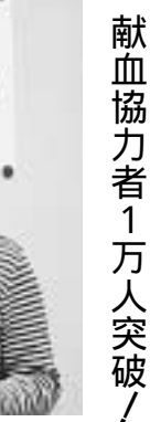
献血協力を1万人突破！