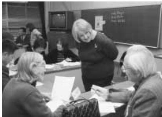
今年1月～3月に行われた同講座の授業風景。英会話を学びながら、スポークン市を理解しよう