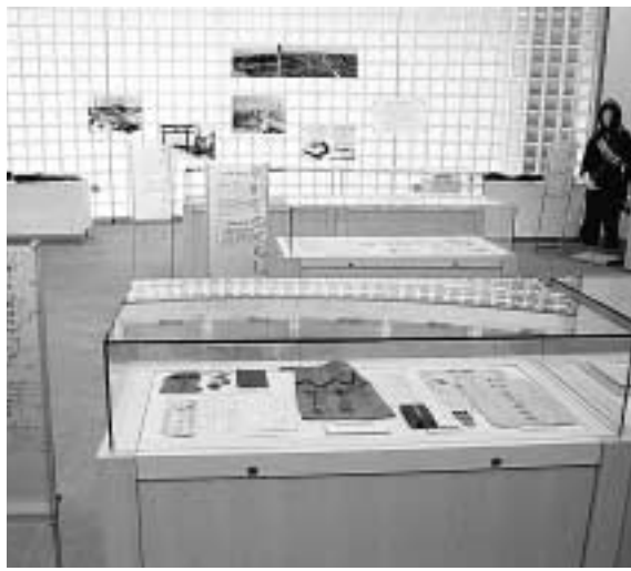
貴重な戦災資料が展示されています

参加申込・問合せは同実行委員会(078・360・8282)・県生活復興課(内)へ。