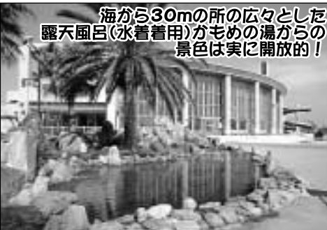
海から30mの所の広々とした露天風呂(水着着用)が毛めの湯からの景色は実に開放的!