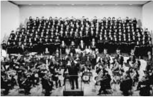
昨年の追悼コンサートの様子