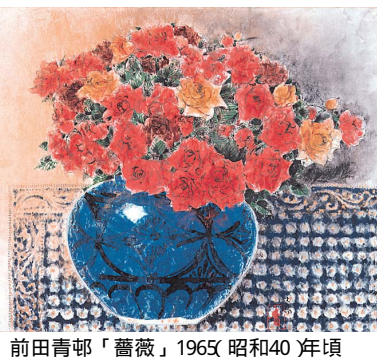
前田青邨「薔薇」1965 昭和40 年頃

● 展示作品紹介 岡鹿之助は1898（明治31）年東京麻布に生まれ、東京美術学校を卒業後、1924（大正13）年より約15年間