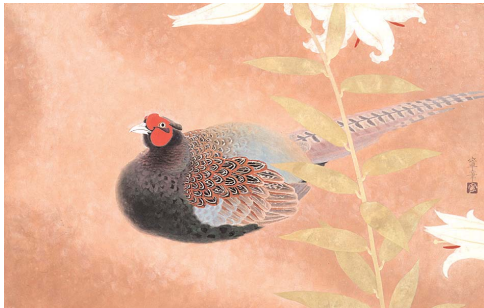
杉山寧「雉山百合図」1953 昭和28 年

子のある静物」、児島善三郎「イスを着る女」、安井曾太郎「治黄檗風景」など、代表的な画家たちの作品に出会うことができます。