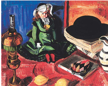
小出楯重「帽子のある静物」1923 大正12 年

つた女性が描かれています。若葉の緑と赤い着物との色の対比が、効果的に配されています。