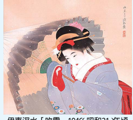
伊東深水「吹雪」1946 昭和21 年頃