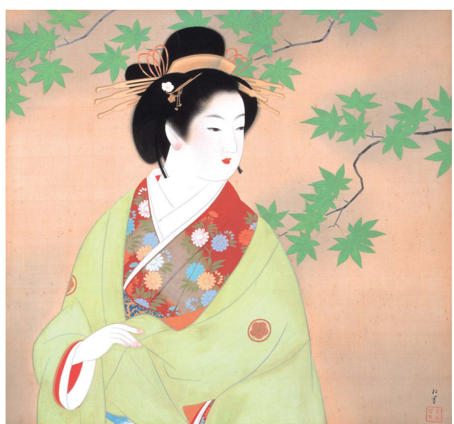
上村松園「清韻」1943 昭和18 年

油彩画では、梅原龍三郎「霧島栄ノ尾」をはじめ、岡鹿之助「雪の変電所」、小出楯重「帽子のある静物」などがあります。