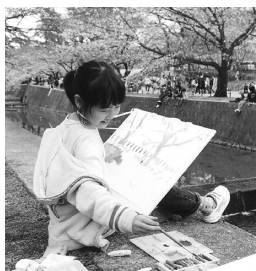
思い出を絵に残しませんか〜昨年の絵画写生大会から

※観桜茶会 6日午前10時〜午後3時に片鉾池北側で。西宮茶華道協会による抹茶のお茶席。有料。雨天時は夙川公民館で