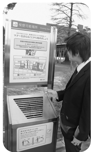
指定場所での喫煙にご理解を

4月6日から、喫煙禁止区域内での違反行為(喫煙可能場所以外でたばこを吸う、または火のついたたばこを所持すること)に対して、過料の徴収が始まります。金額は、十分な抑止効果が期待できる1000円に設定しました。 身分証明書を携帯した市職員が区域内を巡回し、違反行為をしている人を見かけた場合は、その場で過料1000円を徴収 市は今後も、市内公共の場所での歩きたばこをしないよう周知し、喫煙に対する市民意識の向上と喫煙者のマナー啓発に努めていきます。 問合せは環境都市推進グループ(0798・35・3803)へ。