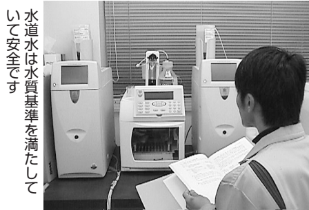
水道水は水質基準を満たして いて安全です

水道局は、平成16年度より水質検査計画を策定しています。この計画に基づき、厳しい水質管理を行い、皆さんに安全な水道水をお届けしています。 今年度の水質検査計画についてお知らせします。 問合せは水質試験所（0798・51・62662）へ。