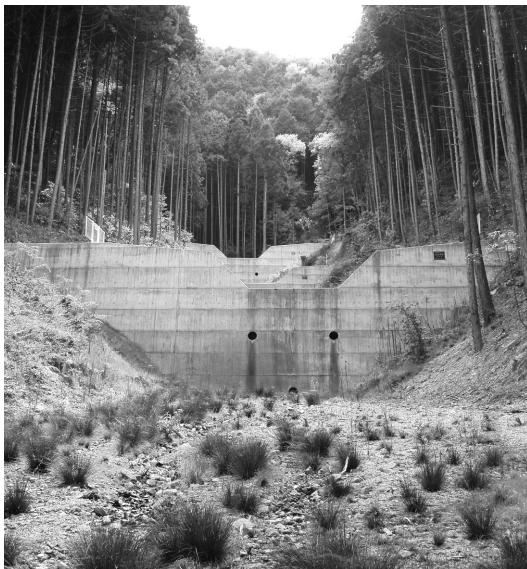
治山ダムを設置で渓流に緩斜面をつくり、谷から土砂の流出をくい止め浸食を防止し、流れる方向もコントロールします