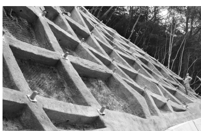
のり枠工で斜面の安定化を図り土砂災害被害を抑えます