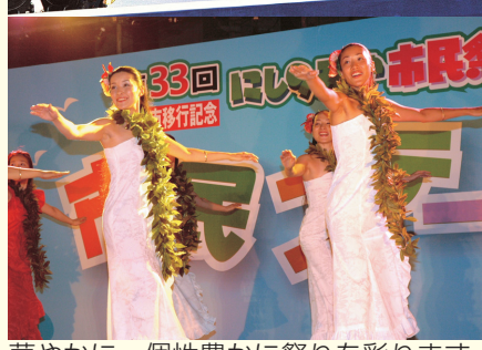
華やかに、個性豊かに祭りを彩ります