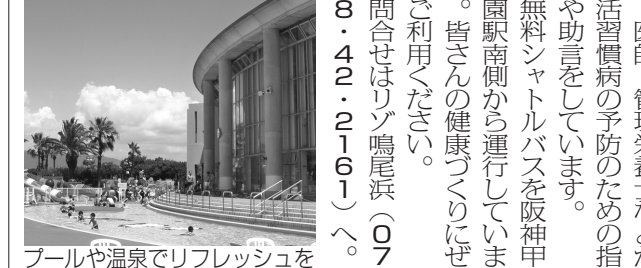
プールや温泉でリフレッシュ

【入館料】プール・温泉：1700円(中学生1300円、小学生1000円、3歳～小学校入学前700円) ※午後5時以降は割引あり