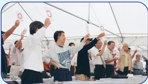
昨年の日本酒塾。マルバツ形式のクイズを通して日本酒の知識を深める

会館で 【受講料】500円 【定員】各回60人(40人までハガキ申込。残りは当日午前10時から総合案内で受付、先着順) 【申込】ハガキに催し名、住所、氏名、年齢、電話番号、希望時間を書き、9月30日(必着)までに、西宮酒ぐらルネサンスと食フェア実行委員会(〒662-0854 榎塚町2-20:西宮商工会議所内)へ。多数の場合抽選