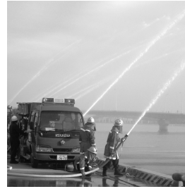
船舶やヘリコプター、防災機関の車両も登場します

市は、白水峡公園墓地の使用者を募集します。 【対象】 次のすべての要件を満たす人▷10月10日現在、市内に住民登録か外国人登録をしている人。ただし、阪神・淡路大震災により他市へ住所を移した人は可(全半壊・全半焼の被災証明書が必要)▷配偶者、6親等内の血族、3親等内の姻族の遺骨・焼骨(分骨は不可)があり、お墓を主としてまつる人 ※天災・事故などにより遺体を回収できないため遺品を埋蔵する場合は相談を 【募集数・使用料等】 3平方苜…111区画・62万8290円～65万5140円▷5平方苜…15区画・117万円～122万円 【申込】 所定の申込書を10月27日(郵送の場合消印有効)までに西宮市都市整備公社斎園管理課(〒662-8567 六湛寺町10-3市役所本庁舎8階 ☎0798・35・3306)へ郵送を。持参も可 ※申込書は10月12日～27日に同課で配布しているほか、郵送希望者は返信用切手140円分と「募集案内希望」、住所、氏名(ふりがな)、電話番号を書いたものを封書で10月20日(必着)までに同課へ。1人1通。業者には配布しません 【現地相談】 10月16・17日の午前9時～午後4時。同日以外でも見学可(午前9時～午後5時15分)