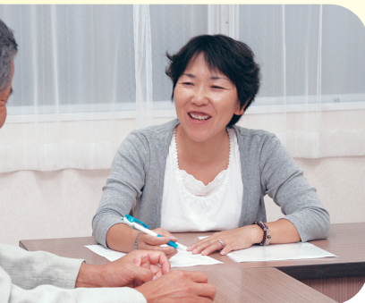
コーディネーターが相談に応じ、ボランティア活動などを紹介します

12月4日午後2時から市民交流センターで「市民活動マッチングセミナー」を開催します。このセミナーでは、講師がボランティアなどの市民活動について説明します。また、市内で活動するボランティアグループなどの市民活動団体の紹介コーナーも設けています。 「コーディネーターと対面で相談するのは気が引ける」という人は、同セミナーに参加しませんか。 【受講料】無料 【定員】50人 【申込】11月15日午前10時から電話で市民活動コーディネーター事業事務所へ。先着順