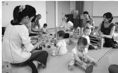
木のおもちゃに夢中の子どもたち

申込が必要な催しは、ハガキに講座名(③は参加希望日も)、住所、氏名、子の氏名・年齢、電話番号を書き、各申込締切日(必着)までに子育て総合センター(〒662-0853津田町3-40 ☎0798・39・1521)へ。多数の場合抽選(④は初参加者優先) ※同センターのホームページ( http://www.nishi.or.jp/homepage/nobinobi/ )からも申込可