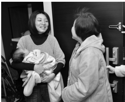
健康やか赤ちゃん訪問事業

地域の中での交流や見守りなど、子育て家庭が地域から孤立しないよう、地域ぐるみによる支援が続いています。