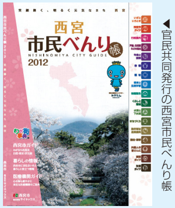
官民共同発行の西宮市民べんり帳

指しています。それ以外の市が設置した施設の管理についても、多様化する住民ニーズにより効果的・効率的に対応するため、積極的に施設管理の民間委託を推進しており、平成26年4月には274施設で指定管理者が管理することになります。また、指定管理者の公募を拡大するとともに、運営状況についてもチェック体制を整えてしっかりと確認しています。