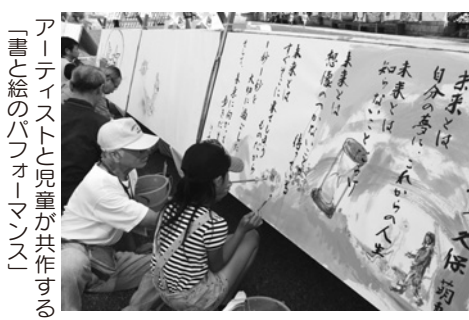
アーティストと児童が共作する「書と絵のパフォーマンス」

今年の特テーマは「チャレンジ」です。メインモニュメント「みんなでつくろう!ぼくもわたしも芸術家」では、皆さんに会場でモニュメントを作ってもらいます。また、市内と宮城県南三陸町の一部の小学生から募集した「チャレンジ」の詩を会場に展示します。そして、その中から選ばれ