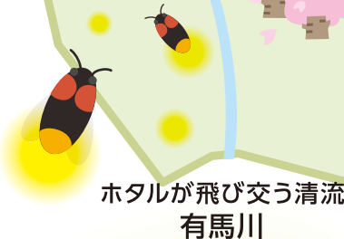
ホタルが飛び交う清流 有馬川

問題② ○○○○ A 温泉 武庫川渓谷の自然に恵まれた閑静な地にある温泉。紅葉や名物ぼたん鍋で季節を感じてみてはいかが!?