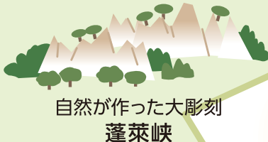
自然が作った大彫刻 蓬萊峡

問題③ 甲東○○○ C ○ 甲東公民館の庭に39種(約200本)の梅を植えているよ。毎年2月～3月には多くの人を訪れるよ!!