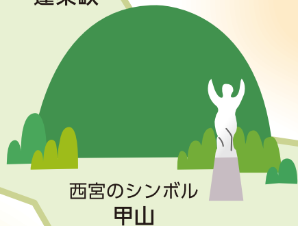
西宮のシンボル 甲山