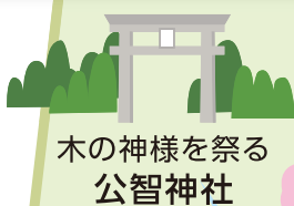
木の神様を祭る 公智神社

問題① ○○○ B ○○湖 春の桜並木は絶景!ウォーキングコースとしても最適だよ!!