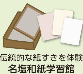
伝統的な紙すきを体験 名塩和紙学習館

問題② ○○○○ A 温泉 武庫川渓谷の自然に恵まれた閑静な地にある温泉。紅葉や名物ぼたん鍋で季節を感じてみてはいかが!?