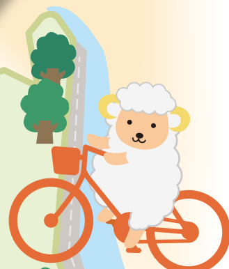
全長7.1kmを 楽しく走ろう 武庫川 サイクリング ロード

問題④ ○○○○ E トンネル JRの線路下をくぐり抜けるための通路。谷崎潤一郎さんの『細雪』にも登場するよ。西宮の知る人ぞ知る名所!!う～～○○○○!!