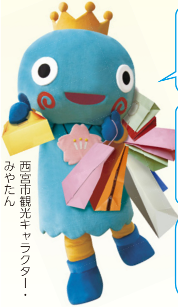
西宮市観光キャラクター「みゃたん」

今夏、西宮市プレミアム付き商品券発行協議会は、「西宮市プレミアム付き商品券」を発行します。商品券の利用者や商品券取り扱い店舗として、どしどしご利用ください！