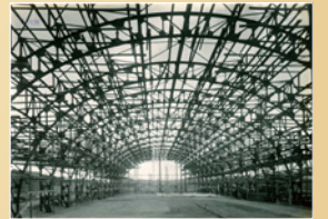
白鹿館瓶詰工場 建築中の鉄骨 昭和4(1929)年

酒どころとして発達した西宮。町づくりに大きく関わった酒造家の活動を紹介します。 時間 午前10時～午後5時(入館は4時半まで) 休館 火曜、8月17日～19日 入館料 200円。小・中学生100円 TEL 0798・33・0008 アクセス 鞍掛町8-21。阪神西宮駅から南へ徒歩15分