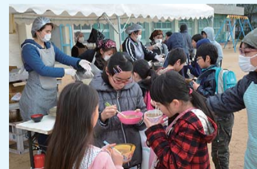
多世代が交わる熱気と炊き出しで寒さを忘れませ

そのために人が交わり関われる機会として、催しをどんどん行い、地域の防災力を高めていきたいですね。