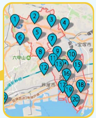
地図上でも雨量が分かる