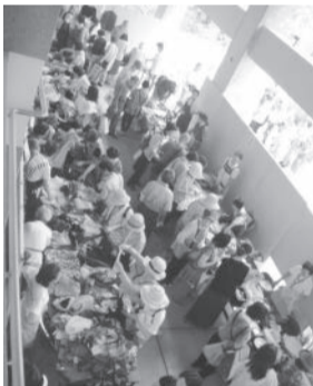
盛況な様子のチャリティバザー

日本ユネスコ協会連盟のコーアクション事業(開発途上国の発展に先進国の人々が自ら関わりをもち、互いに協力し合うもの)を支援するためバザーを開催。収益金の一部は同連盟を通じて、東日本大震災子ども教育支援募金や世界寺子屋運動などに寄贈されます。今年度は9月10日(日)に夙川公民館で開催予定。