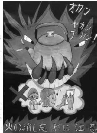
平成30年度 最優秀作品

最優秀賞1点、優秀賞2点、入賞5点 ※最優秀賞に選ばれた作品は「令和2年春の火災予防運動ポスター」として市内各所に掲示。入賞者には賞状と副賞を贈呈。応募者全員に参加賞あり