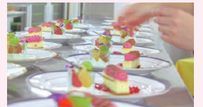
▲昨年の西宮Sweets Liveの様子

西宮洋菓子ブランド発信事業実行委員会は、「西宮洋菓子園遊会～西宮Sweets Live」への参加者を募集します。市内洋菓子店のパティシエが一堂に会し、各パティシエが趣向を凝らしたアシェットデザート(お皿に盛りつけられたデザート)をコースで提供します。