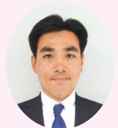
西宮市長 石井 登志郎

市といたしましては、今後も日々変化する状況を注視し、医療機関等と連携を密にしながら、一日も早い事態の鎮静化に向けて全力を尽くしてまいります。