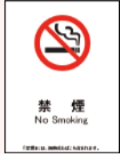
飲食店の店舗入口には禁煙の表示が必要です

飲食店や公園、運動施設も4月1日から原則禁煙となります。一部の施設では喫煙場所(室)を設けていますが、20歳未満の人と妊婦は立ち入ることができません。喫煙前に各施設のルールを確認しましょう。