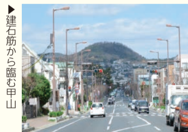
▶ 建石筋から臨む甲山

一生懸命やったことは全部生きてくるし、何かにつながつていきます。また、子供たちを大人がみんなどで支え、大事に育てていく。そんなまちになれば、さらに良いまちになると思っています。