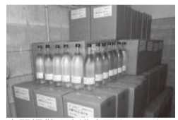
大関提供の高濃度アルコール