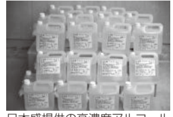
日本盛提供の高濃度アルコール