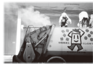
ごみの収集車両内での火災