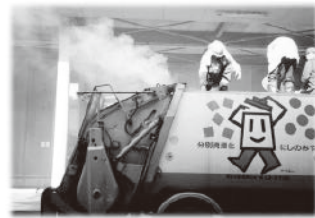
ごみの収集車両内での火災

中身が残ったスプレー缶やカセットボンベが原因とみられる車両火災が、全国的に発生しています。収集車両内で、缶内に残ったガスが漏れ出して引火することで、火災や爆発が発生し、作業員や近隣住民に被害が出る恐れがあります。カセットボンベ等をごみに出す際には、必ず中身を使い切ってから出すようにしてください。