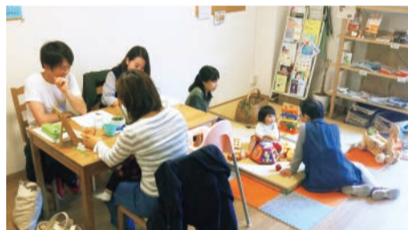
「まちcafeなごみ」では、さまざまな世代の人が訪れ、交流しています