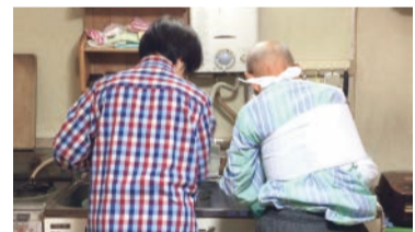
けがをしている高齢者をサポートする様子

ませんでした。訪問をしたり電話で様子を聞いて、困っていたら助けに行ったり…。コロナ禍で自粛している若い世代の中でも、何かできないかという思いから活動する人も出てきて、登録者はさらに増えました。