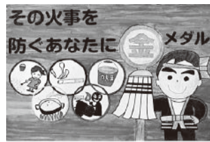
昨年度 最優秀作品

西宮市消防局と西宮市防火保安協会は、火災予防を呼びかけるポスターを募集します。子供たちの火災予防に関する自由な発想を生かした作品をお待ちしています。