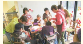
▲共生型地域交流拠点の様子