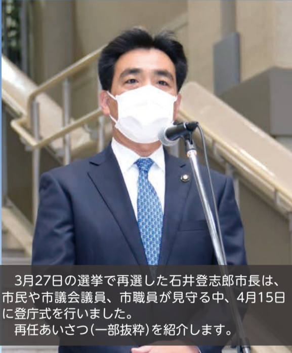
3月27日の選挙で再選した石井登志郎市長は、市民や市議会議員、市職員が見守る中、4月15日に登庁式を行いました。再任あいさつ(一部抜粋)を紹介します。