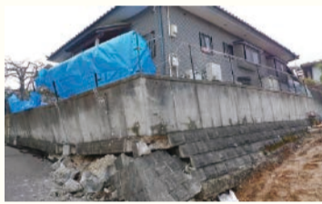
地震の影響で擁壁が崩れ、傾いた家