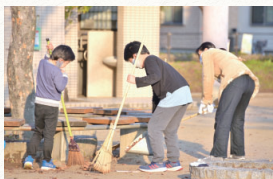
▲みんなでまちをきれいにします

本市では、毎年2回、市内で一斉清掃を行います。今年も12月11日に市内827カ所で行われます。今年も12月11日に市内827カ所で行われる予定です。ぜひこの機会に、参加いただくとうれしいです。市内各所でご準備いただいている皆さん、本当にありがとうございます。皆さんの日々のご貢献あつての西宮市です。心より感謝申し上げます！当日が絶対のお掃除日和となることを願っています！